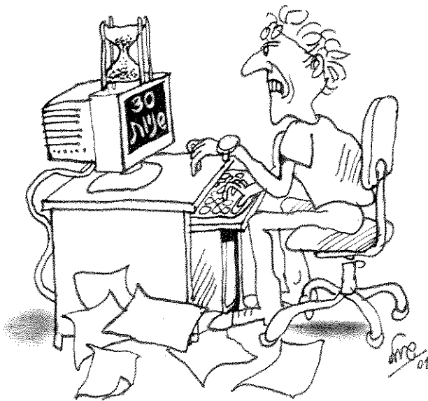
"לפני שהעיתונאי מוציא דברים מתחת ידו, יהרהר 30 שניות אם נבדק מה שהיה נחוץ"

כמעין סוג של בידור, המחליף ספרות בדיונית בספרות מן החיים, וכולנו כביכול שחקנים על הבימה. כשלעצמי קשה לי מאוד לחבור לתפישה מעין זו, אך אי אפשר לומר שאינה קיימת.