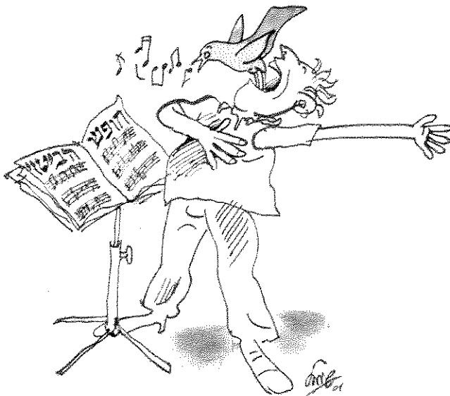
"ציפור הנפש של הדמוקרטיה"

נדמה לי שיש תמימות דעים או הסכמה רחבה באשר לצורך בשידור ציבורי. כמובן תנאי ראשון במעלה לאמינותו של השידור הציבורי הוא הגינותו, שמירה על אובייקטיביות, הגינות העומדים בראשו, אי ניצול הכלי הציבורי למטרות זרות. לא תמיד הדבר קורה והיו דברים מעולם. אכן, גם אם מרבית הנוגעים בדבר פועלים בהגינות, כשיש